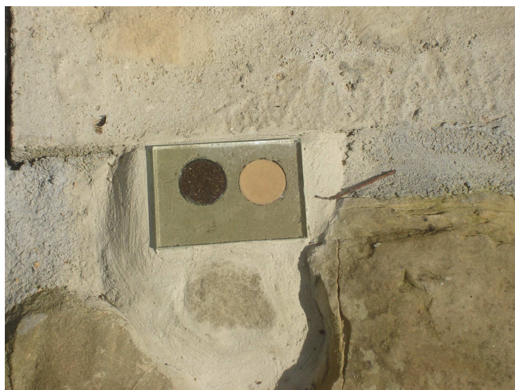
Ziemia z Lasu Katyńskiego – kolor czarny Ziemia z miejsca katastrofy – kolor żółty