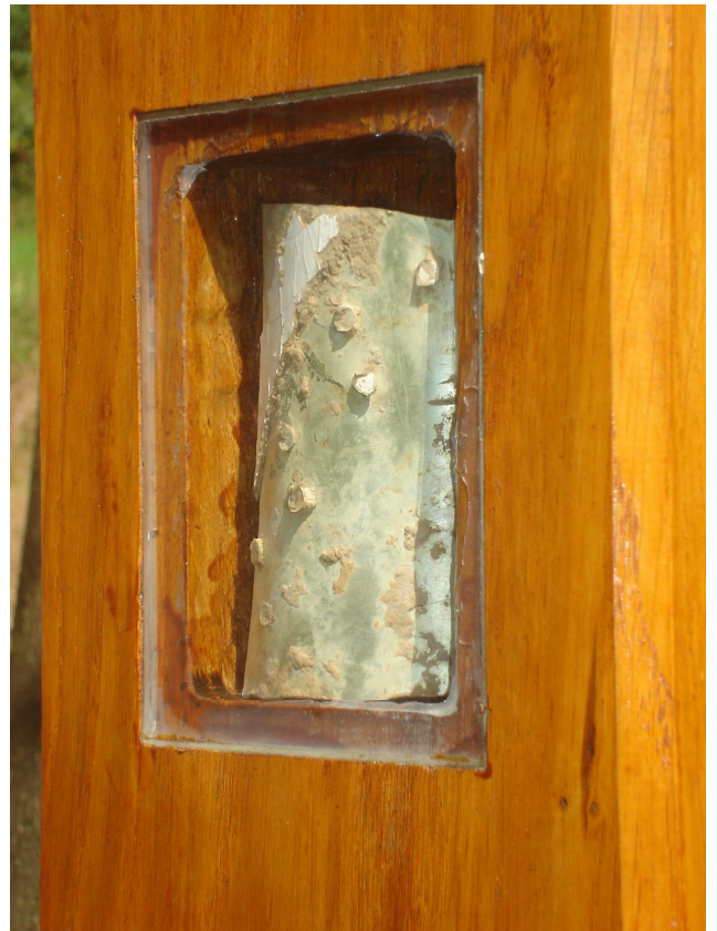
Fragment samolotu TU-154 wbudowany w drzewo Krzyża Jubileuszowego